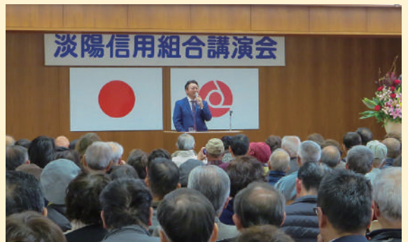
2018年度 講演会 舞の海 秀平 氏