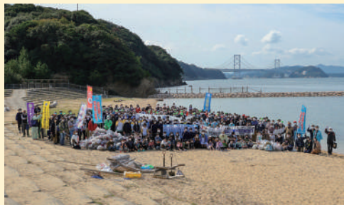
鳴門海峡（南あわじ市 阿那賀伊弉海岸）

その渦潮の世界遺産登録を目指す地域住民や議員、事業所などが加わる6団体でつくる実行委員会の主催により、渦潮発生メカニズムに大きく関係している鳴門・紀淡・明石の3海峡で清掃活動が行われ、当組合からも86名の役職員が参加しました。