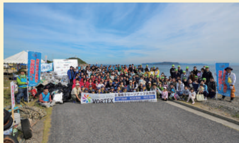
紀淡海峡（洲本市 由良生石海岸）