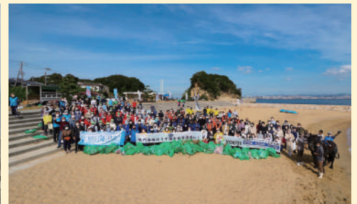
明石海峡（淡路市 岩屋ノ代海岸）