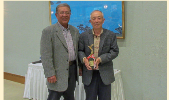
淡陽会ゴルフコンペ

「淡陽レディースクラブ」は、洲本市に在住する取引先のご婦人の親睦を図るため1986（昭和61）年10月に設立され、旅行や観劇、食事会などの行事を行っています。