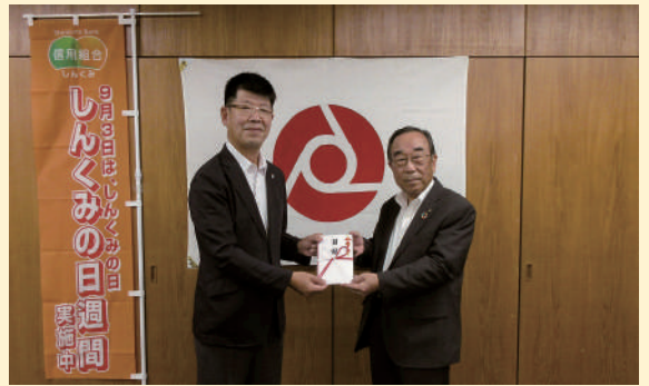
ピーターパンカード寄付金贈呈式

当組合は2002（平成14）年度からこの活動に取り組んでおり、2021年度は淡路市の児童養護施設聖智学園に寄付金を贈呈しました。